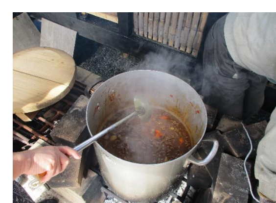
かまどベンチを使って炊き出したカレーがそろそろ出来上がるころです。