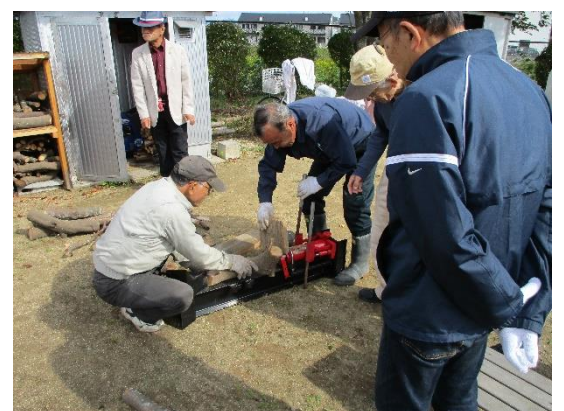
薪割り機を使って焚き木をつくる