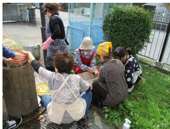
カレーに欠かせない野菜を洗う