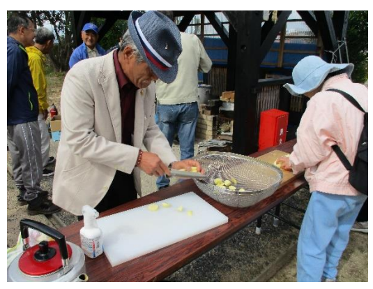
受講者も野菜切りにチャレンジ①