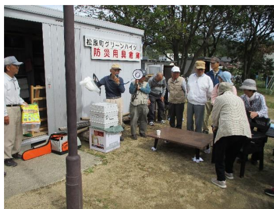
カレーが出来上がるまでの時間を活用し、自主防災会のみなさんが「簡易トイレ」「給水袋」などの説明をしてくださいました。