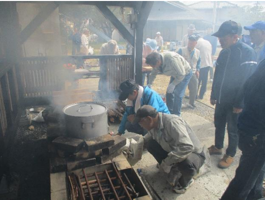
炊き出しの真っ最中です！！