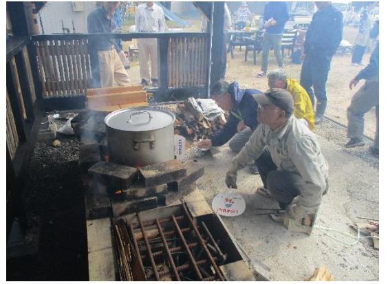
まさにサバイバル体験です！