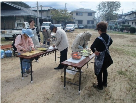
受講者も野菜切りにチャレンジ②