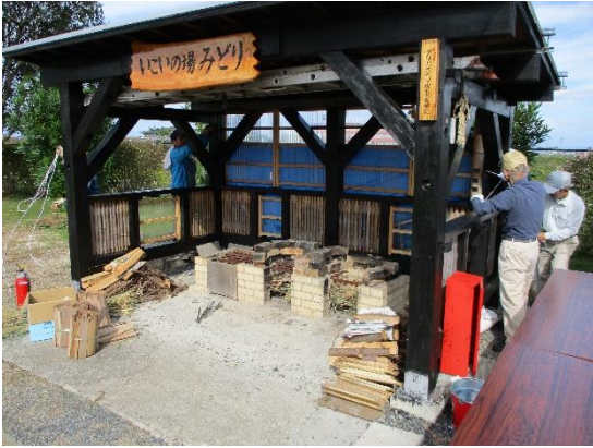
休憩用の普通「ベンチ」が「災害時用かまど」に大変身していきます！